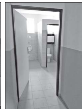
Skončila rekonstrukce kulturního domu v Jackově. Na základě výsledku výběrového řízení ji prováděla firma Šibor stavby s.r.o. Litoňov s nejnižší nabídkovou cenou ve výši 506 386 Kč bez DPH. Byla provedena rekonstrukce vnitřních prostor kulturního domu – sociálního zařízení a kuchyňky. Text a foto: OSRI