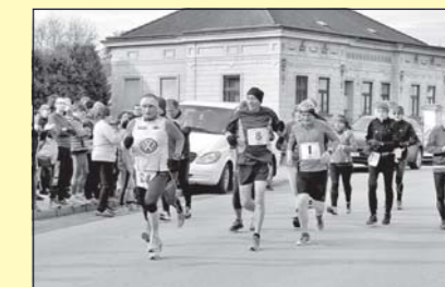
Maraton Jana Buly (str. 15)

MORAVSKOBUDĚJOVICKO • Měsíčník Městského kulturního střediska Beseda a obcí Moravskobudějovického mikroregionu, periodikum územního samosprávného celku. Vydává MKS Beseda, příspěvková organizace, Purcnerova 62, 676 02 Moravské Budějovice, IČ 00091758 nákladem 5 400 výtisků. Evidenční č.: MK ČR E 11632.