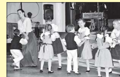
Martínkovské soubory v Rouchovanech (str. 10)