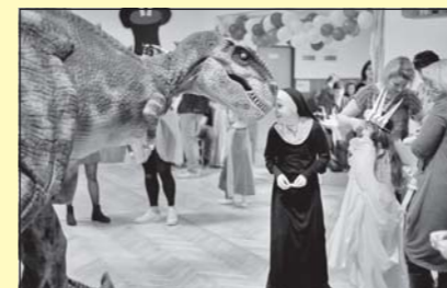
Na parketu s dinosaurem (str. 7)