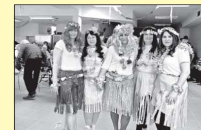
Masopust v Domě sv. Antonína (str. 7)