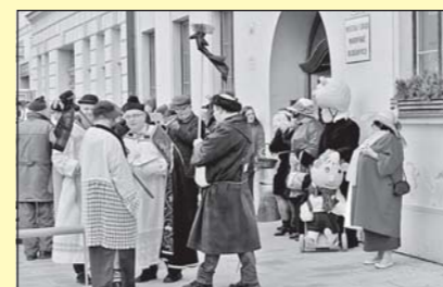
Pochovávaní Basy budovské (str. 5)