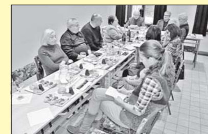
Valná kromada muzejního spolku (str. 6)