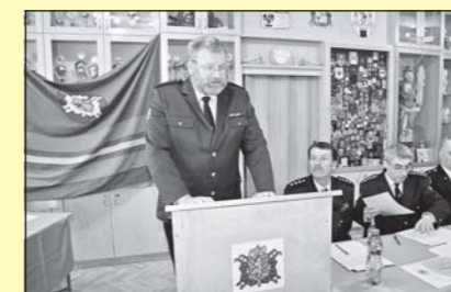
Valná hromada okrsku č. 24. (str. 8)