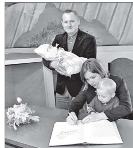
Ani tentokrát nemohly chybět podpisy většiny aktérů slavnostního přijetí do pamětní knihy města.

pocítili to, co už znáte. City rodičů, šťastných a hrdých zároveň. Přeji vám, abyste úspěštilé rodičovské city mohli intenzivně prožívat po celý život. A abyste po celý život byli šťastni a hrdí na své děti,” uvedla ve svém proslovu místostarostka. Současně vyjádřila přání, aby se Moravské Budějovice pro všechny přítomné staly vždy dobrým a bezpečným místem k životu a nikdy na své rodné město nezapomínali.