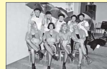
Hasičský ples v Častohosticích (str. 14)