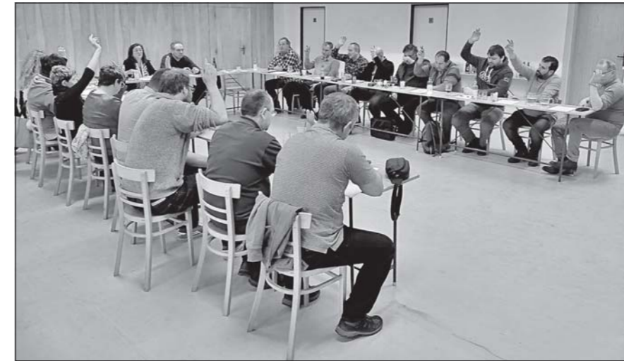
Jednání členské schůze mikroregionu hostila lukovská Vlachovka.

proběhlo ve velice věcném duchu. Také při schvalování všech usnesení panovala shoda a hlasování bylo pokaždé jednomyslné.