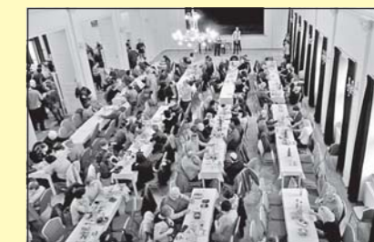
Pozvání na ochutnávku vín (str. 15)

MORAVSKOBUDĚJOVICKO • Měsíčník Městského kulturního střediska Beseda a obcí Moravskobudějovického mikroregionu, periodikum územního samosprávného celku. Vydává MKS Beseda, příspěvková organizace, Purcnerova 62, 676 02 Moravské Budějovice, IČ 00091758 nákladem 5 400 výtisků. Evidenční č.: MK ČR E 11632.