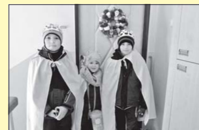
Tříkrálová sbírka na Želetavsku (str. 13)