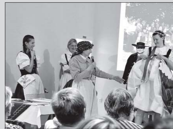
Přednáška v Budovoji byla velice zajímavá.