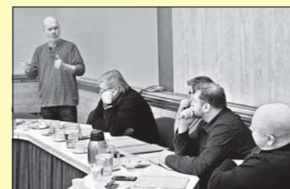
Jednání o autobusovém spoji. (str. 4)