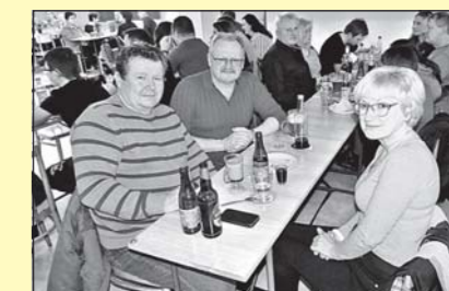
Vepřové hody v Lukově (str. 12)