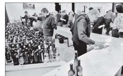
Loňská ochutnávka nabídla celkem pět stovek vzorků vín.

Vinařský spolek Moravské Budějovice a MKS Beseda Vás zvou na