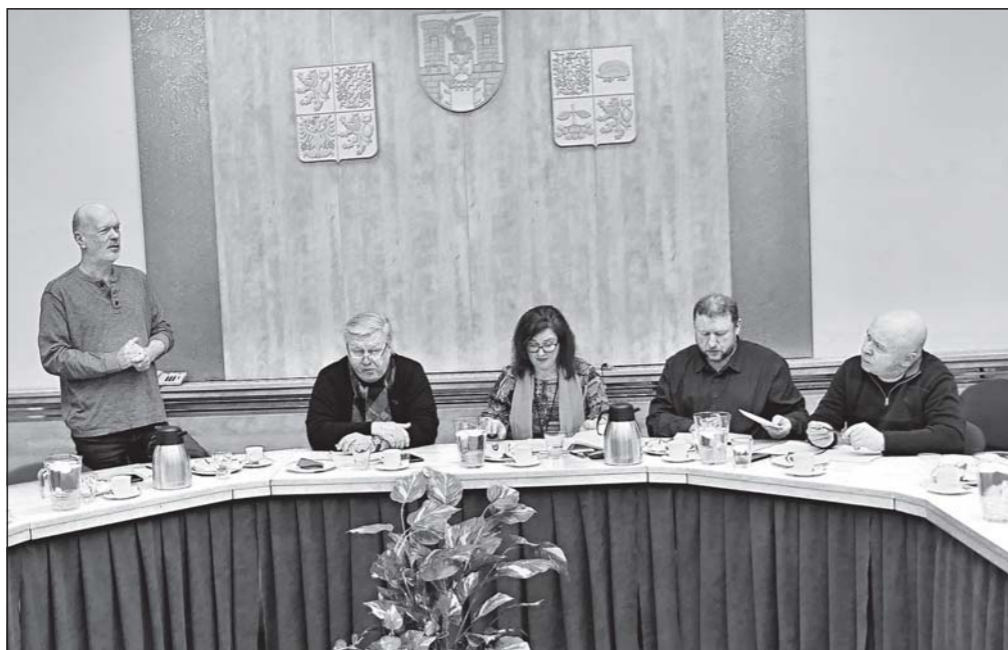
Jednání na moravskobudějovické radnici se zúčastnil i zástupce dopravní společnosti, která nevyloučila zájem o obnovení zrušeného spoje do Brna.

Jihočeského a Jihomoravského kraje, aby i oni vyslechli argumenty starostů a zástupců obcí, přistoupili konstruktivně k potřebám obcí v regionu, který je z hlediska dopravní obslužnosti více než problematický. Starostové budou usilovat o obnovu zrušeného spoje a zároveň pro možné jednání s dopravcem připraví základní variantu spoje (případný dopravce